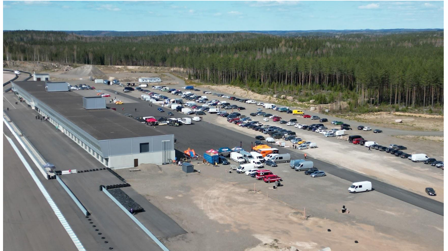
Kuva: Teuvo haara